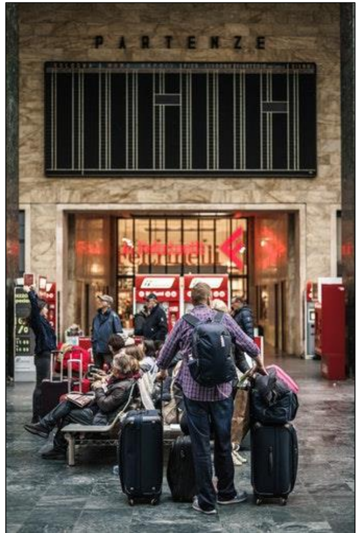
Foto: person standing beside the luggage bags