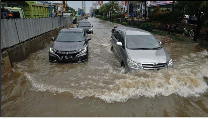
Foto: Genangan air di daerah Kelapa Gading

Hujan deras mulai sering datang dalam beberapa waktu belakangan. Dampaknya beberapa ruas jalan mulai menggenang. Meski cenderung lebih aman, pengendara mobil perlu tetap berhati-hati saat hendak menerobos genangan air yang cukup tinggi.